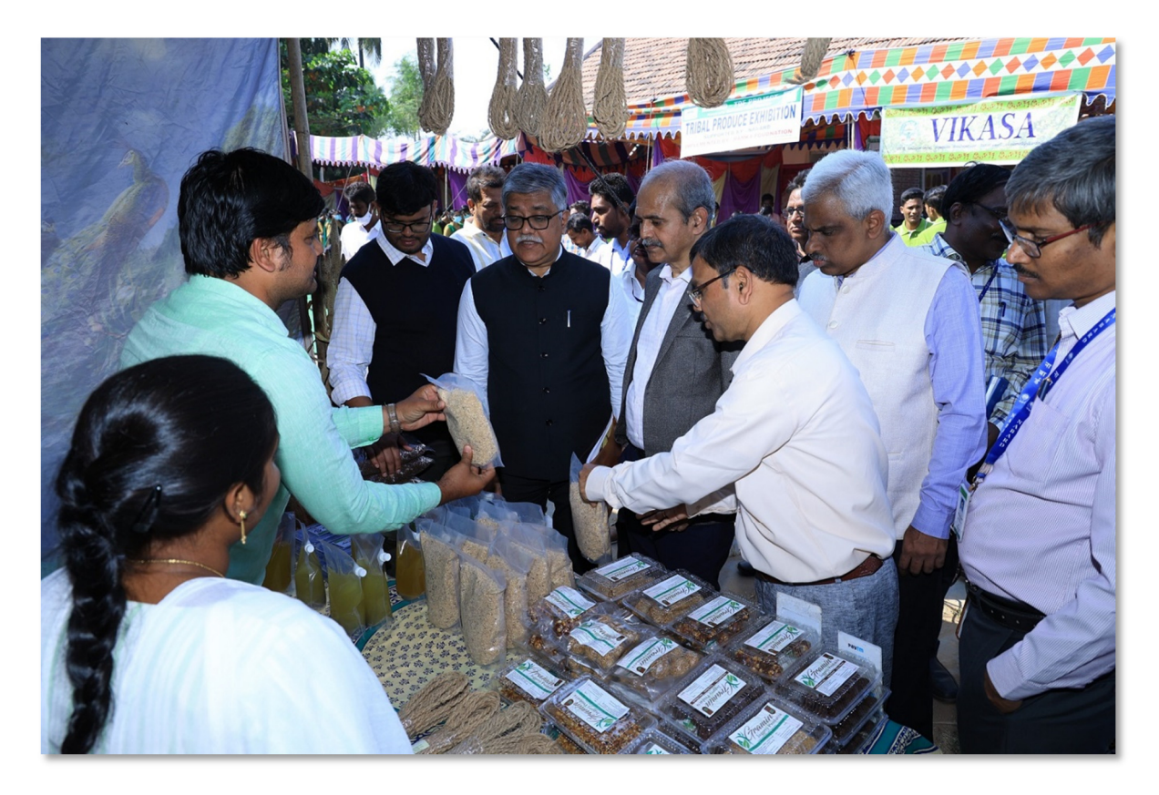
Dignitaries interacting with exhibitors