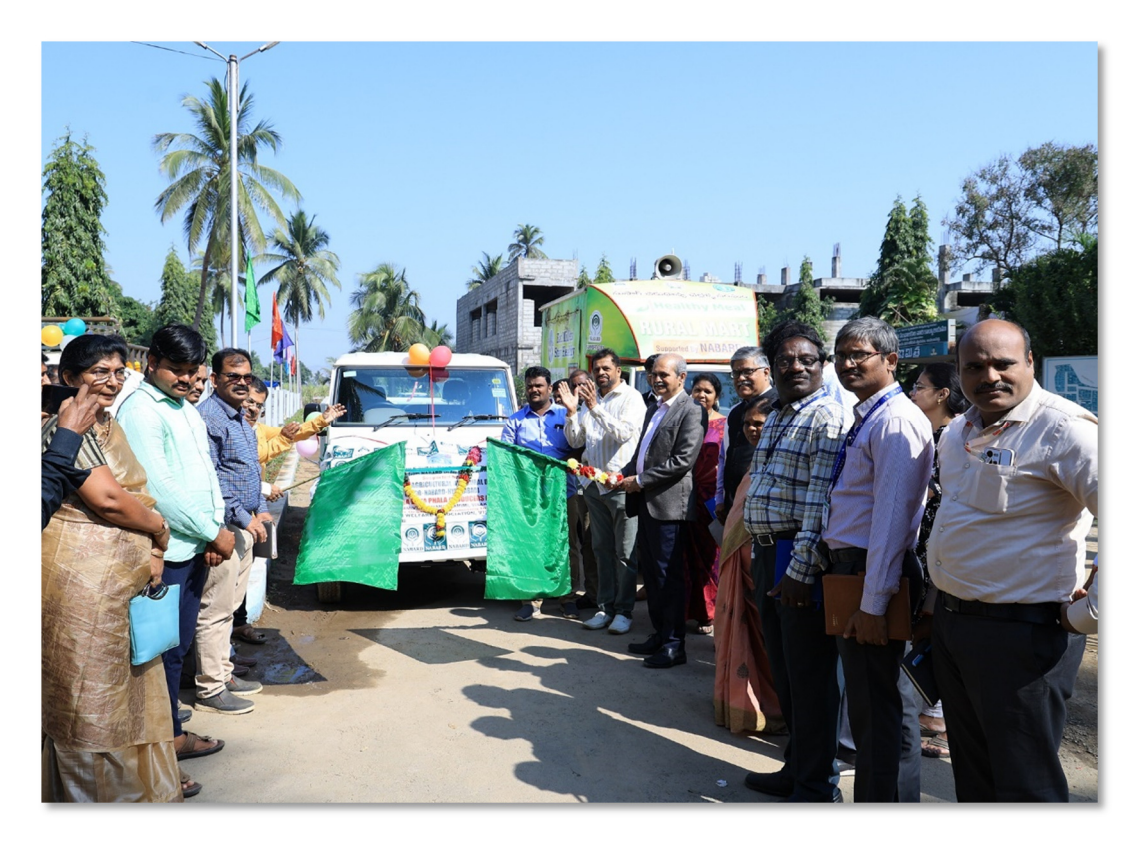
Flagging off the mobile Rural Mart van sanctioned to a millet based FPO under OFDD