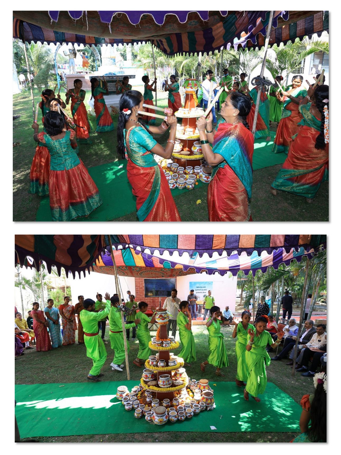
Cultural activities – folk dance