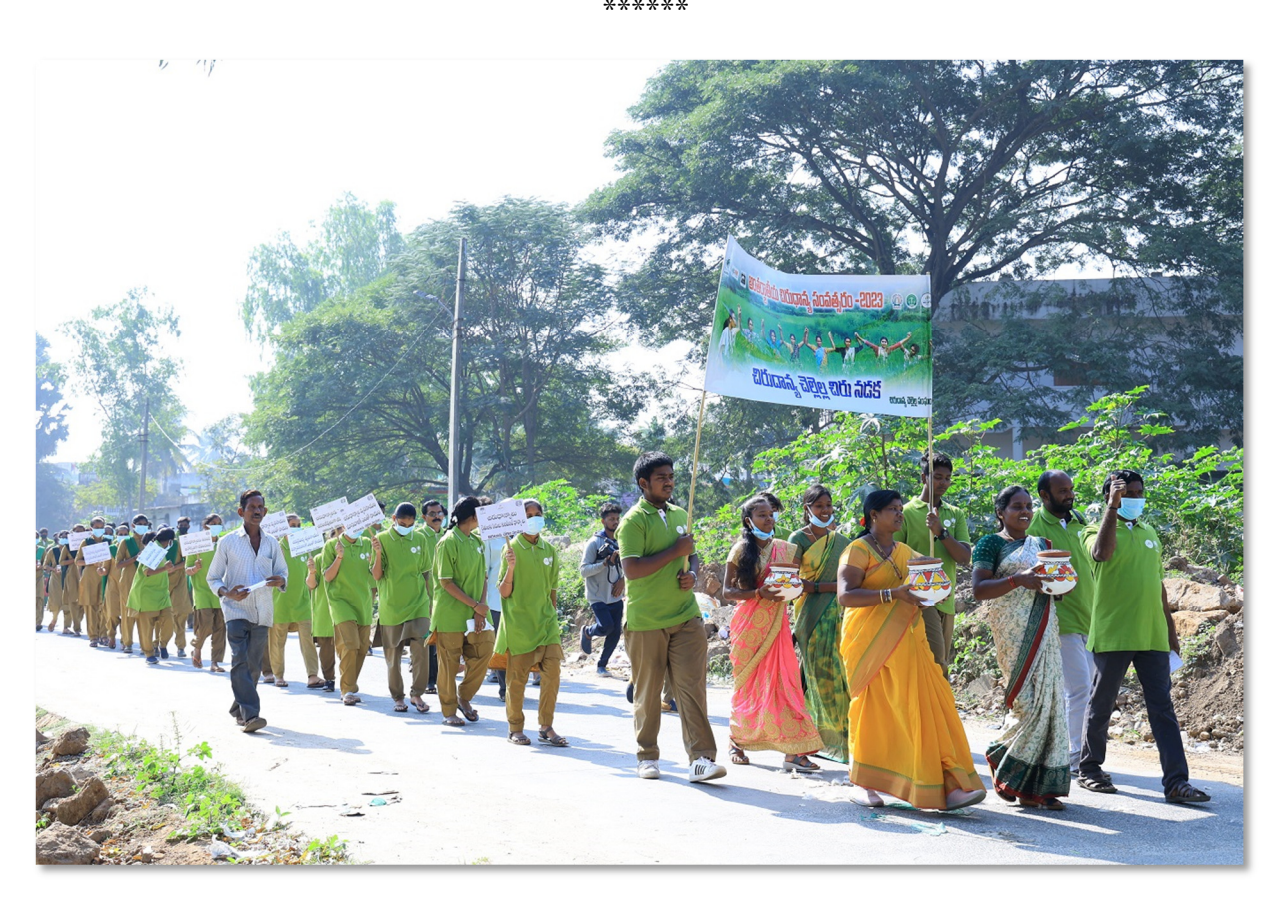
Walkathon organised to create awareness on Millets

Few Photographs and press Clippings are appended.