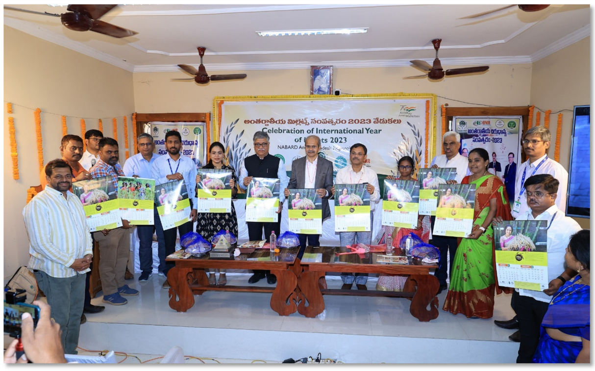
Launching of Millet Calendar – 2023